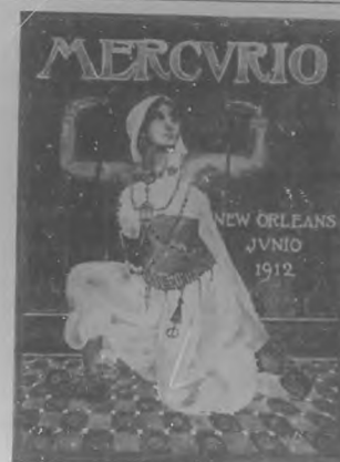
Facsímil de la cubierta de Mercurio correspondiente al mes de Junio.