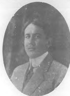
† JESUS CASTELLANOS