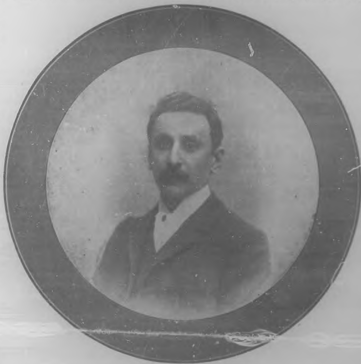
D. Melquiades Alvarez

del oyente la emoción y la persuasión, envueltas la una en la otra y fundidas en un solo maravilloso efecto. Su pensamiento viril razona con diplectica inflexible; su aliento inflama la idea; su voz vibrante, ayudada del gesto estatuario, lanza la palabra como una exhalación fulmínea hacia el corazón y la mente del auditorio. Es Melquiades Alvarez la oratoria misma, hija predilecta de la Musa Poesía, quien los antiguos personificaron la Elocuencia